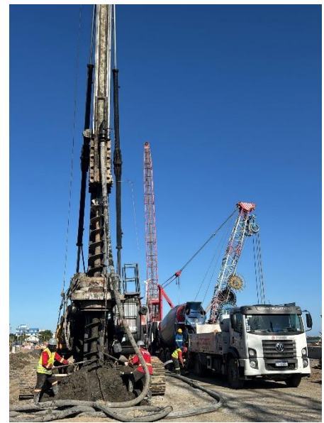
Estacas tipo hélice contínua