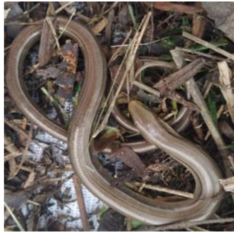
Licranço resgatado nas dependências da empresa