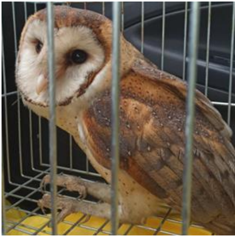
Coruja-das-torres resgatada no Terminal